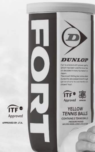
信頼に応え続けるスタンダードな試合球 「ダンロップ フォート」

たった1つのボールの良し悪しが勝敗を左右するトーナメントの世界で、いつも安心してプレーに集中できる均一性を究めた試合球として、ダンロップは選ばれ、国内や海外での数多くのトーナメントを支えています。