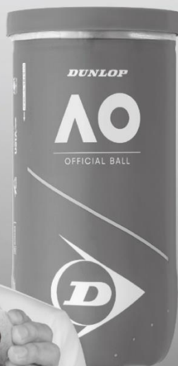
全豪オープンを支える大会使用球 「ダンロップ オーストラリアン オープン」